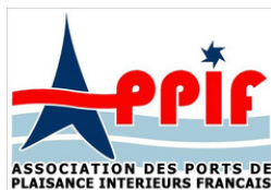
Association des Ports de Plaisance Intérieurs Français