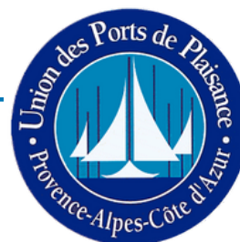
Union des Ports de Plaisance de Provence Alpes Côte d'Azur et Monaco